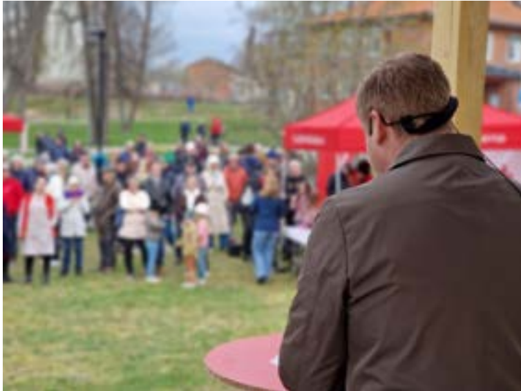
Första maj 2023